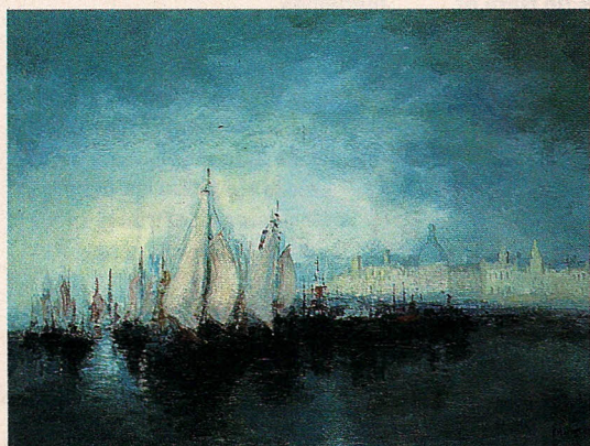
LES VOILES DE LA LIBERTÉ DE MARCEL PELTIER

LA MAGIE DES ORCHIDÉES Avec la participation de Vacherot-Lecoufle et des Associations orchidophiles régionales. Exposition-vente, conférences, projections, animations samedi 23 octobre 14 h - 18 h, dimanche 24 octobre 11 h - 18 h. Tarif unique : 28 F. Château de Vascœuil - 27910 Vascœuil. Tél. : 02 35 23 62 35.