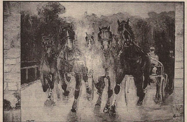
Les oeuvres de M. Peltier, superbes.

Exposition ouverte tous les jours du 24 avril au 27 juin, 14h.30-18h.30 et 11h.-13h., 15h.-19h., tél. 02.35.23.62.35 (Vascoeuil), 01.47.27.45.51 (Paris).